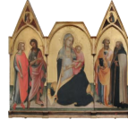
4. Madonna dell'Umiltà