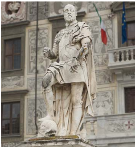
Vittorio Emanuele II di Savoia Re d'Italia 1861-1878

Mantello, corazza con croce, piede sul delfino a simbolo del dominio sul mare: Cosimo è Gran Maestro dei Cavalieri di Santo Stefano al centro della loro Piazza.