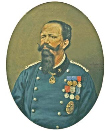
Pietro Leopoldo I d'Asburgo-Lorena Granduca di Toscana 1765-1790

Il primo Re d'Italia è in divisa militare: giubba azzurra con bottoni e cordoni argentati, stellette e insegne dorate, medaglie tra cui una con il Tricolore.