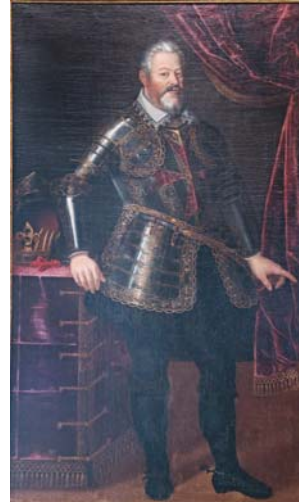
Cosimo I de' Medici Granduca di Toscana 1569-1574

Il terzo Granduca indossa l'armatura con rossa croce e decorazioni in oro da Gran Maestro dei Cavalieri di Santo Stefano; accanto ha elmo, corona e scettro.