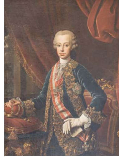
Ferdinando I de' Medici Granduca di Toscana 1587-1609

Il giovane Granduca ha sul ricco abito due simboli dell'Impero d'Austria: fascia dell'Ordine di Maria Teresa e, sul petto, insegne dell'Ordine del Toson d'oro.