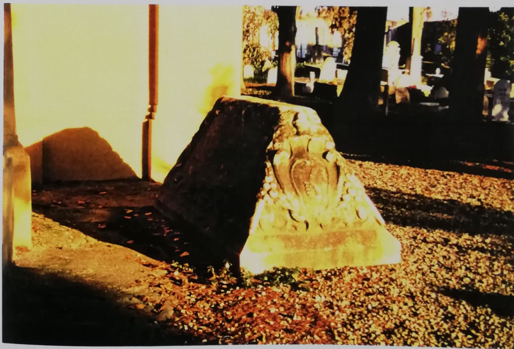
PIETRE TOMBALI POSTE AL LATO CAPPELLA