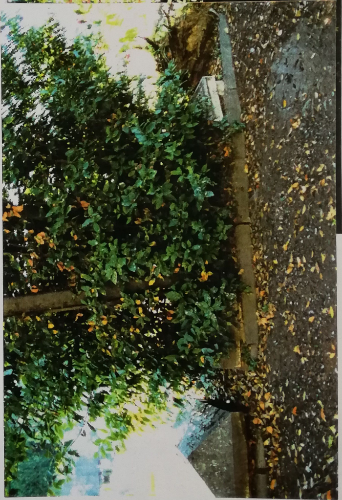
PIETRE TOMBALI POSTE AL LATO QUADRATO B