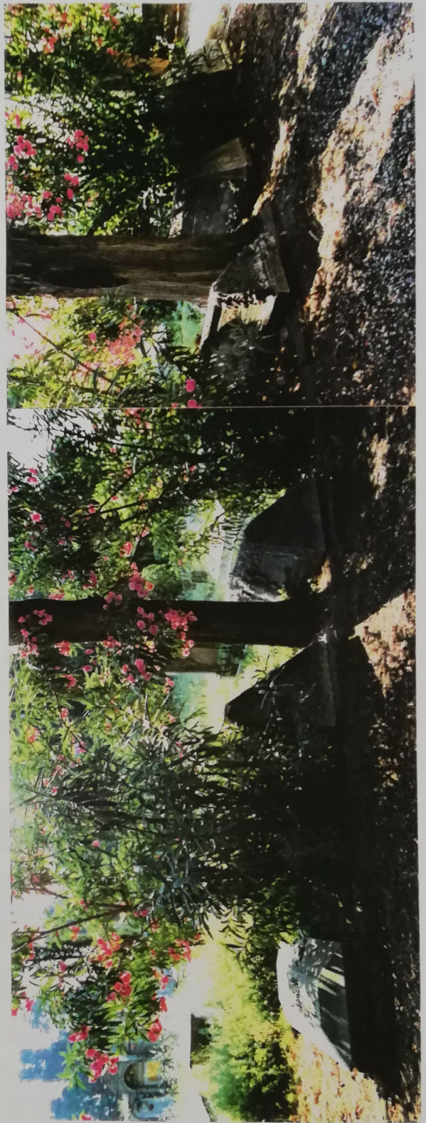
PIETRE TOMBALI POSTE AL LATO QUADRATO A