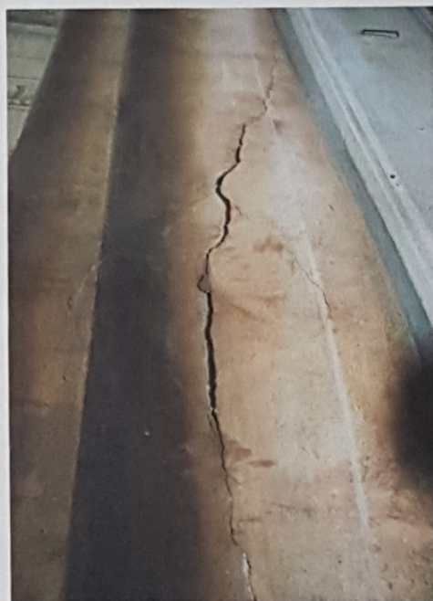
> Particolare di lesione su colonna

_ In questo caso verrà eseguito un ampio intelaggio seguendo la scena architettonica dipinta perche prevedo che dopo il consolidamento e la successiva ripulitura della zona interessata la differenza cromatica con le altre zone non trattate sarà piuttosto evidente, questo a causa della rimozione inevitabile come si può facilmente capire dello sporco superficiale, fatto di fumi e di polveri sottili, questa scelta in ogni caso ci permetterà di delineare e riquadrare in maniera netta e pulita la parte da tutto il resto del dipinto delle pareti del Salone.