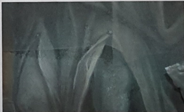
> Parte di figura con parziale velinatura