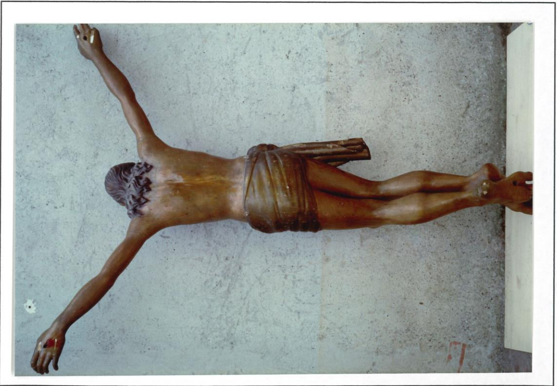
Retro preintervento e ricostruzione corona