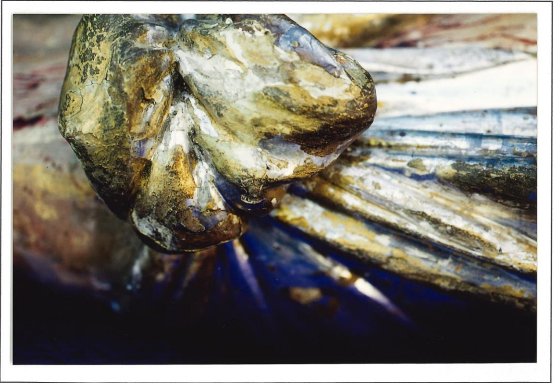
Particolari pulitura e stucchi