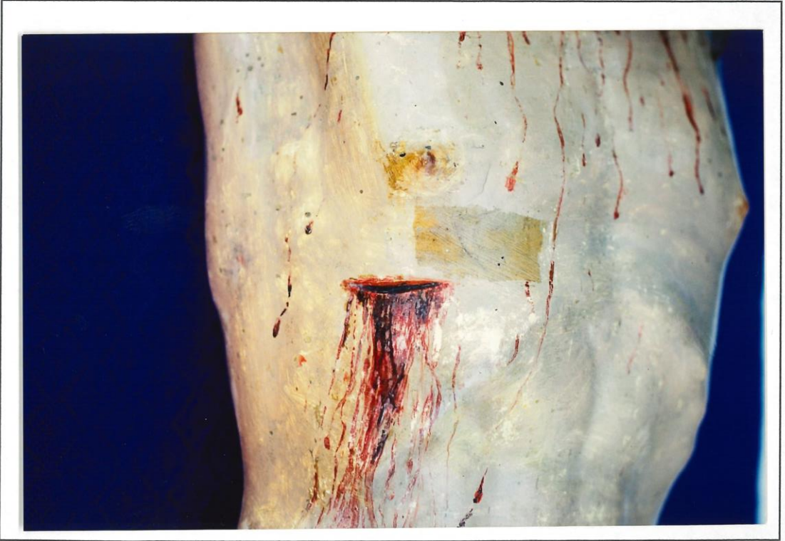
Fasi di pittura