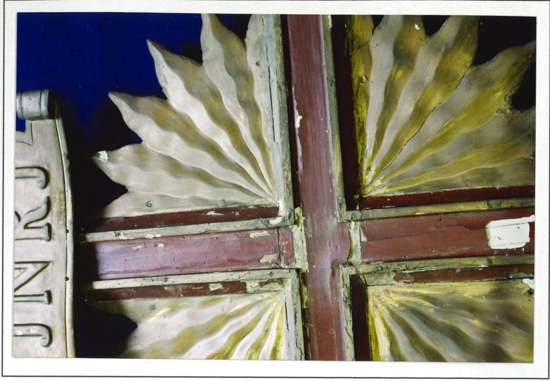
Particolari della croce preintervento