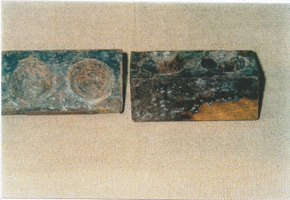
Smontaggio, durante la pulitura