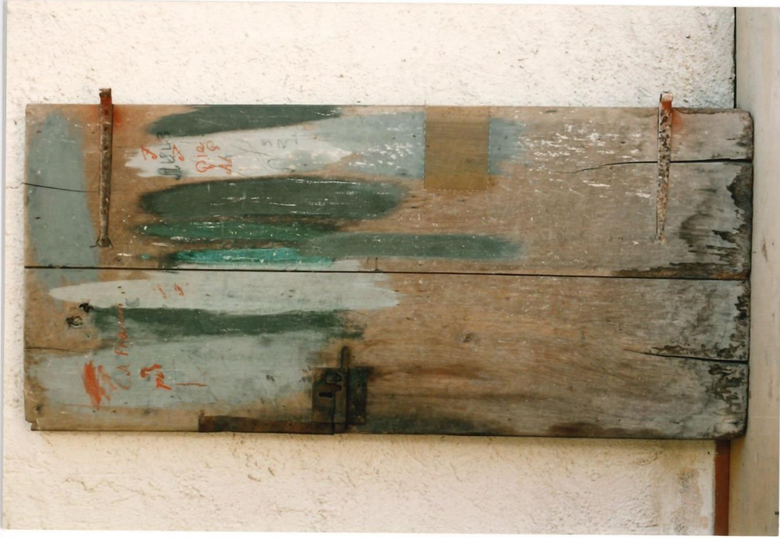
Porta sacrestia sinistra. Retro, prima del restauro