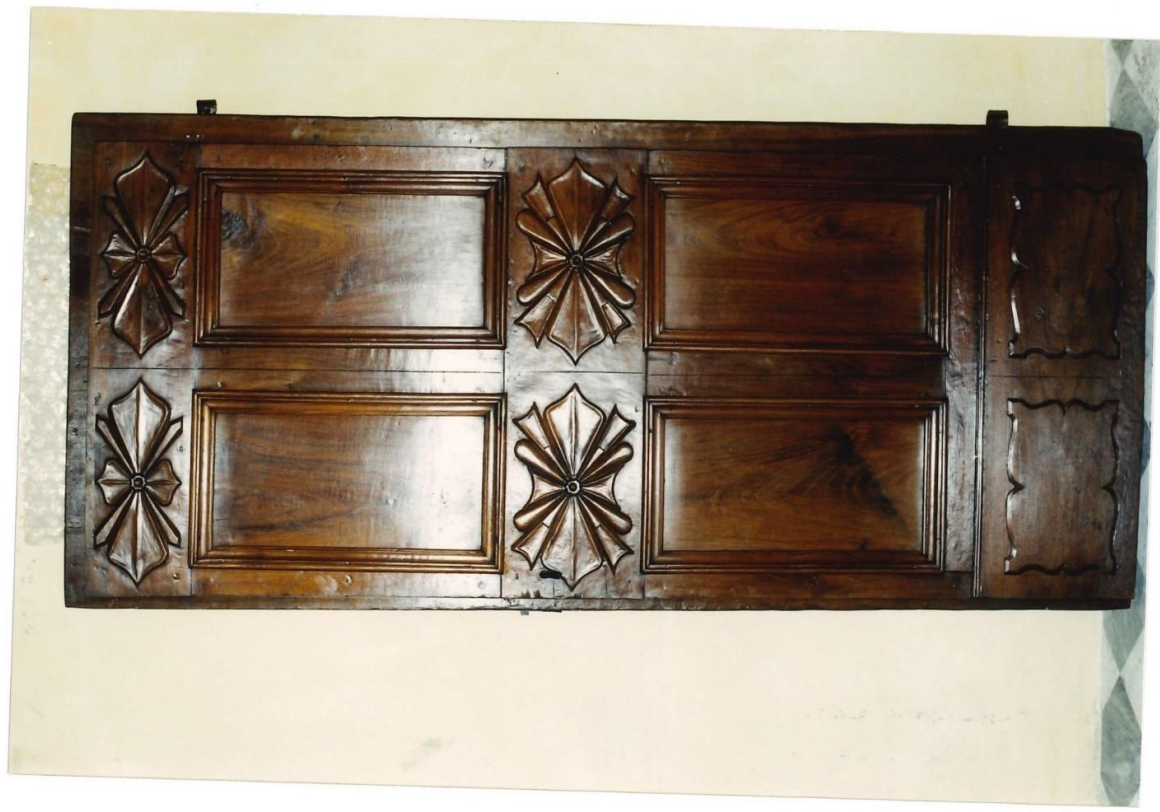
Idem. Dopo l'intervento