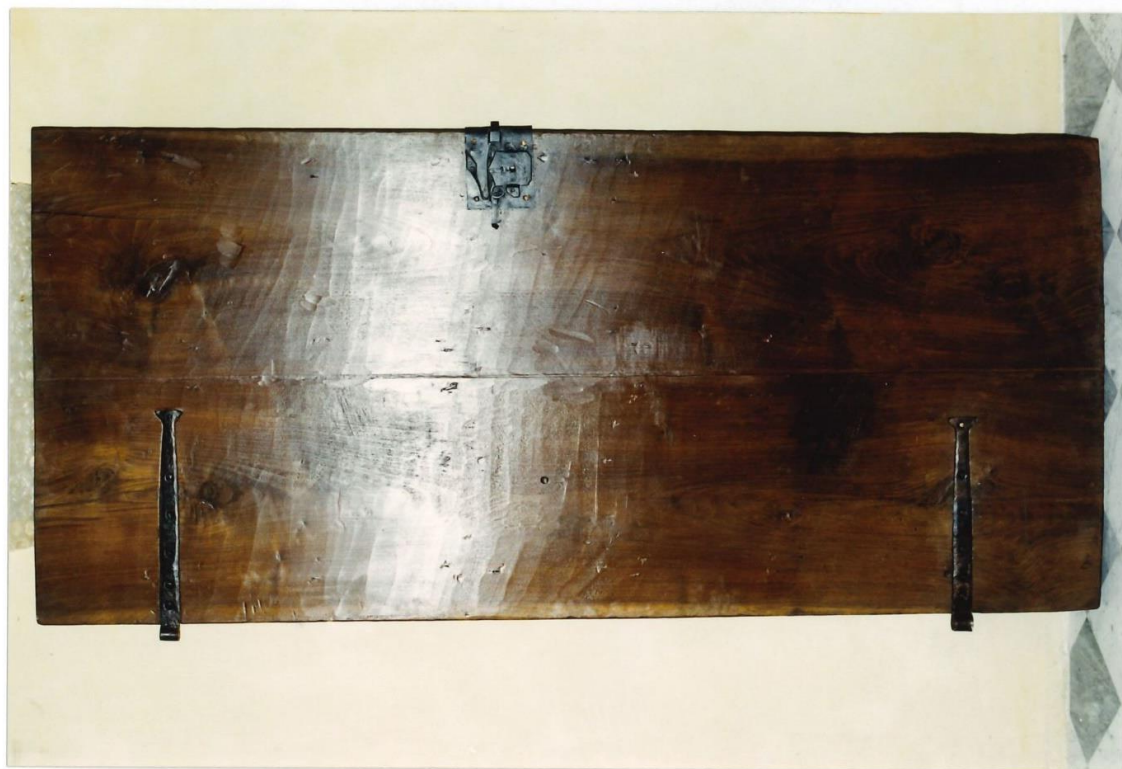
Idem. Dopo l'intervento