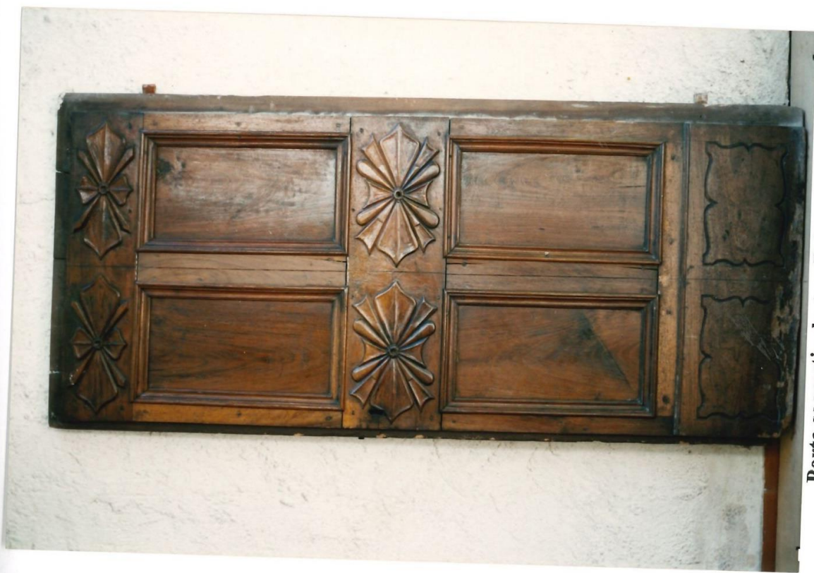
Porta sacrestia destra. Prima del restauro