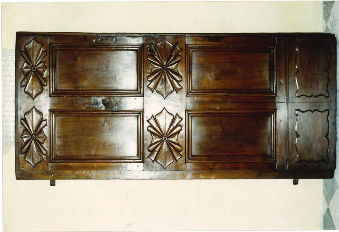
Idem. Dopo l'intervento