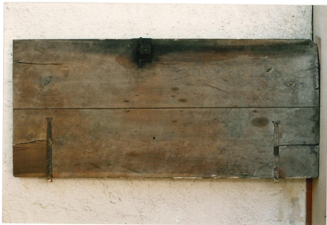
Porta sacrestia destra. Retro, prima del restauro