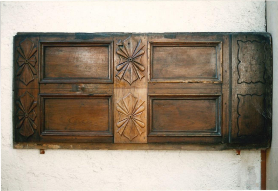
Porta sacrestia sinistra. Prima del restauro