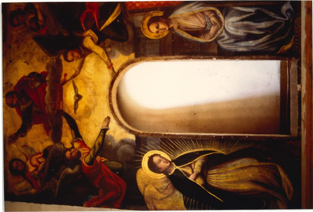
Il dipinto in fase di lavorazione