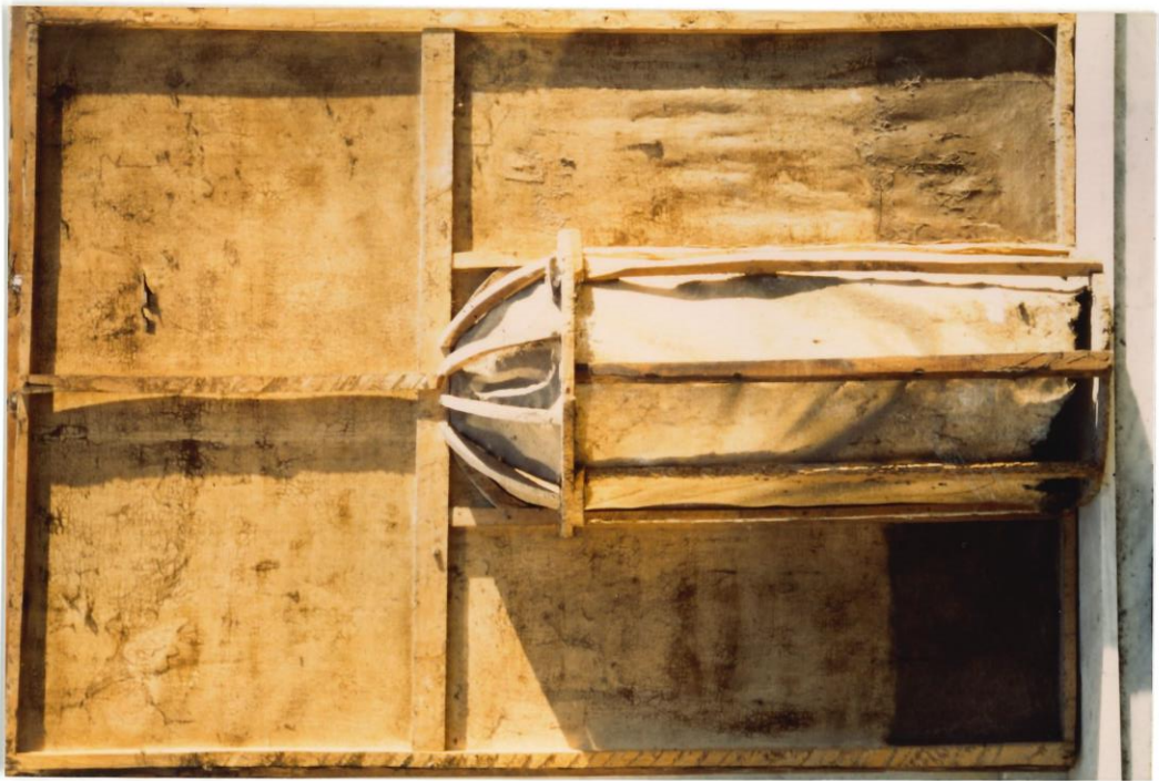
La struttura del telaio