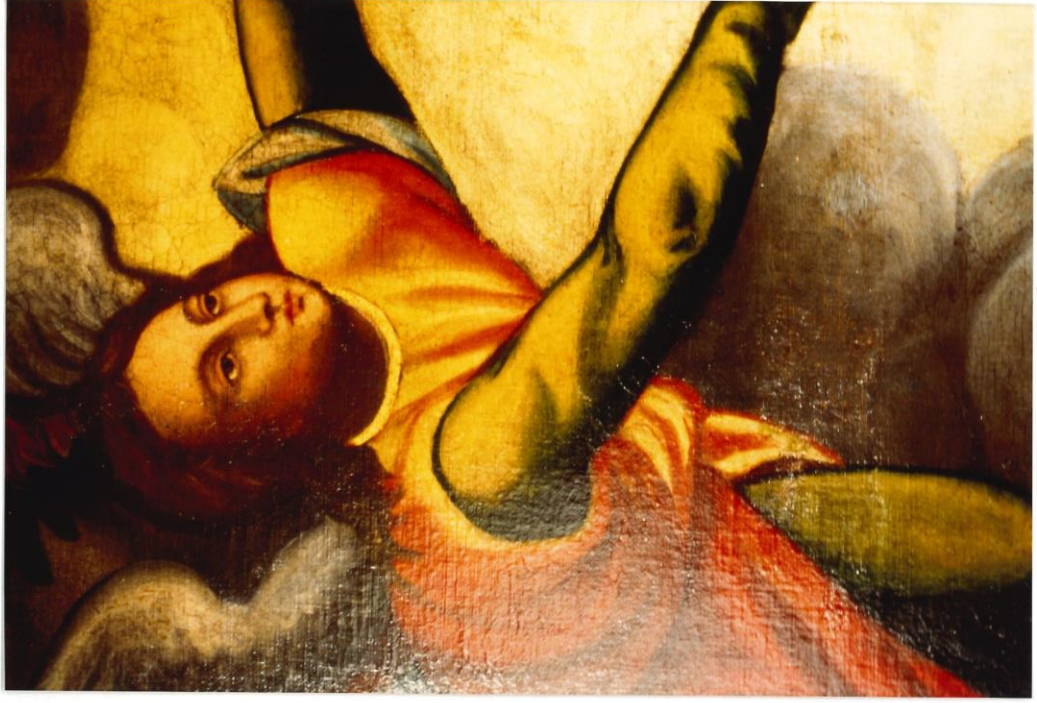
Particolari ad intervento concluso