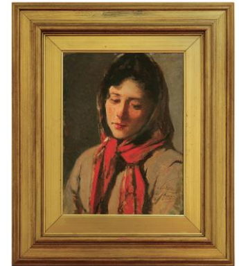
Silvestro Lega, Ritratto di Contadina , 1890