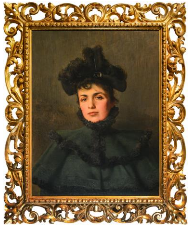
Vittorio Matteo Corcos, Ritratto della moglie , 1889

Quante e quali opere compongono questo strambo ritratto?