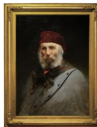
Vittorio Matteo Corcos, Ritratto di Giuseppe Garibaldi , 1882

https://www.museofattori.livorno.it/le-opere/catalogo/ritratto-di-contadina/